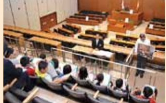
上村小・和田小の皆さん

議場説明は約8千人に 県民に身近な議会づくりの一環として、県庁見学に訪れた小学生の議場見学時に、正副議長や広報委員などが説明をする取組を実施しました。今年度は全体で133校、7、8、14人に実施し、このうち私は、58校(79回)3、121人の皆さんに説明できました。