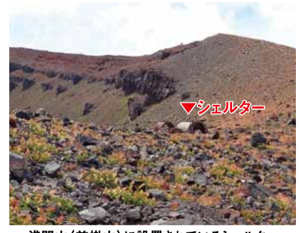
浅間山(前掛山)に設置されているシェルター

「福祉のまちづくり条例」を一部改正 この一部改正条例は、いわゆるバリアフリー法の基準適合義務が生じる施設の対象を、公共性や障がい者等の利用度が高い施設について、現行の延べ床面積2000㎡以上を1000㎡以上へ拡大するほか、対象施設には県独自の整備基準を追加するものです。 今後、多目的トイレへの大人用介護ベットの設置や、ホテル等の客室への障がい者用情報伝達設備の設置などの取り組みが期待されるところです。