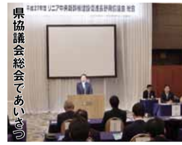
県協議会総会であいさつ

副議長は一般質問を行わないため、定例会の前段に行われる知事と正副議長・各派代表者との懇談会は、知事等に提言・要望する貴重な機会です。今回(11月11日)は次の3点を提起しました。 県境を超えた交流支援 矢筈トンネル開通以来