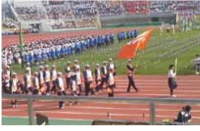
元気よく入場する県選手団

10月24日、和歌山県で開催された第15回全国障がい者スポーツ大会の開会式に出席し、結団式で県選手団を激励しました。皇太子殿下のご臨席の下、全国から選手団、観覧者、大会関係者約1万5千人が参集し、様々なアトラクションも披露され、心に残る開会式でした。