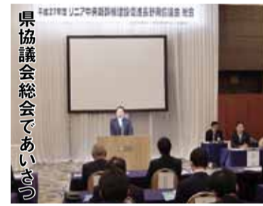
県協議会総会であいさつ

副議長は一般質問を行わないため、定例会の前段に行われる知事と正副議長・各派代表者との懇談会は、知事等に提言・要望する貴重な機会です。今回(11月11日)は次の3点を提起しました。 県境を超えた交流支援 矢筈トンネル開通以来