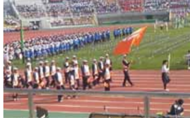
元気よく入場する県選手団

10月24日、和歌山県で開催された第15回全国障がい者スポーツ大会の開会式に出席し、結団式で県選手団を激励しました。皇太子殿下のご臨席の下、全国から選手団、観覧者、大会関係者約1万5千人が参集し、様々なアトラクションも披露され、心に残る開会式でした。