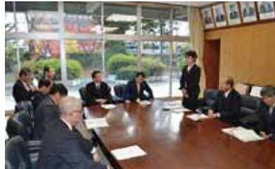
下伊那郡西部の議長や村長さんと

11月10日には、下伊那郡西部村議会議員会からの陳情を、11月26日には、売木村及び売木村議会からの陳情を受けました。いずれも道路の整備をはじめ地域のみなさんにとって欠くことのできない課題ばかりであり、県議会としてもしっかりと取り組むたいと考えます。