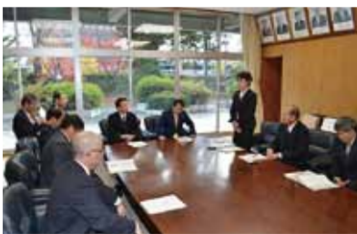
下伊那郡西部の議長や村長さんと

11月10日には、下伊那郡西部村議会議員会からの陳情を、11月26日には、売木村及び売木村議会からの陳情を受けました。いずれも道路の整備をはじめ地域のみなさんにとって欠くことのできない課題ばかりであり、県議会としてもしっかりと取り組むたいと考えます。