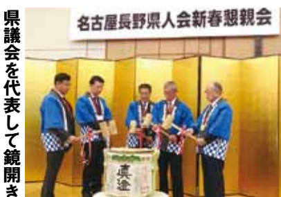
県議会を代表して鏡開き

毎定例会の前段に知事と正副議長・各派代表者との懇談会が行われます。今回(1月22日)私からは次の2点を提起しました。 ・ウルトラマラソンに取り組むながら、スポーツ合宿の誘致などに取り組む。年間1,500人以上になってきた。村でのマラソン大会を実現した